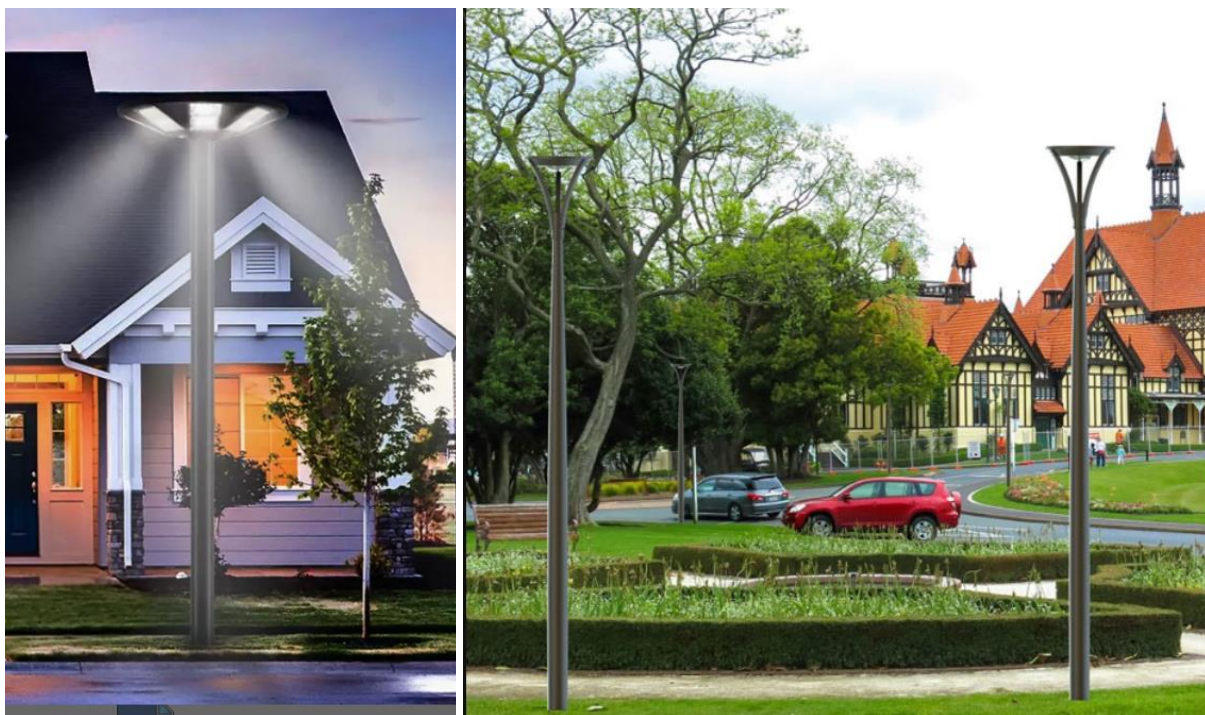
Příklady pouličních svítidel na solární nabíjení (cena 1600 Kč a 7600 Kč bez sloupku)